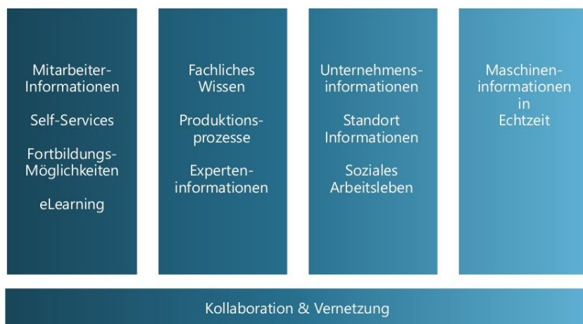
Abbildung 1: Was braucht ein Produktionsmitarbeiter an Informationen und Werkzeugen? Clivot (2015)

das flexibelste Element in allen Prozessen. Das ist keine neue Erkenntnis, denn es sind zumeist die Produktionsmitarbeiter die mit allen Neuerungen auf dem Hallenboden direkt in Interaktion treten. Auch für die Produktionsmitarbeiter wächst die Notwendigkeit bestehende Informationen verstärkt zu vernetzen, um mit verschiedenen Arbeitsbereichen zu kollaborieren und sich auszutauschen (Abb. 1, Clivot 2015). Michael Clivot bezieht sich in diesem Fall auf die Produktionsmitarbeiter der Zukunft und stellt dar, dass diese verstärkt in der Lage sein sollten Mitarbeiterinformationen, Fachwissen sowie Unternehmens- und Echtzeit-Maschineninformationen miteinander zu vernetzen und zu verstehen. In optimaler Weise sollen ihnen Fortbildungsmöglichkeiten gewährt werden, um sich im fachlichen und sozialen Arbeitsleben weiterzuentwickeln. Andererseits können auch neue Formen (atypische Beschäftigung) von dezentraler und outgesourceter Auftragsarbeit verstärkt Einzug halten, in Persona sogenannte Crowd- und Clickworker (Freelancer) Das Verhältnis der Flexibilität der Anstellungen zu kontinuierlichen Beschäftigungsverhältnissen und sozialer sowie tariflicher Absicherung (Gastbeitrag 2015) wird sich in Zukunft herauskristallisieren und ist zum jetzigen Zeitpunkt auch ein Kernpunkt aktueller Dialoge von Vertretern der Arbeitnehmer, Arbeitgeber, Politik und Forschung und durchaus umstritten (vgl. BMAS 2015, BMBF 2015 & Initiative